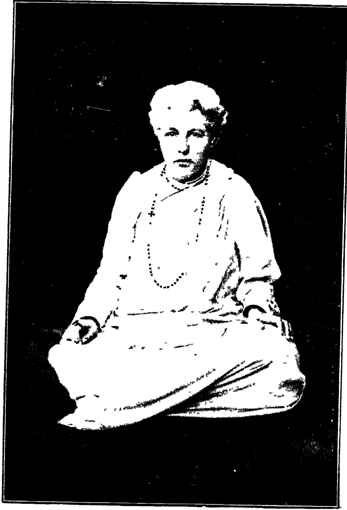
ध्यान-मुद्रामे भगवती बेसण्ट